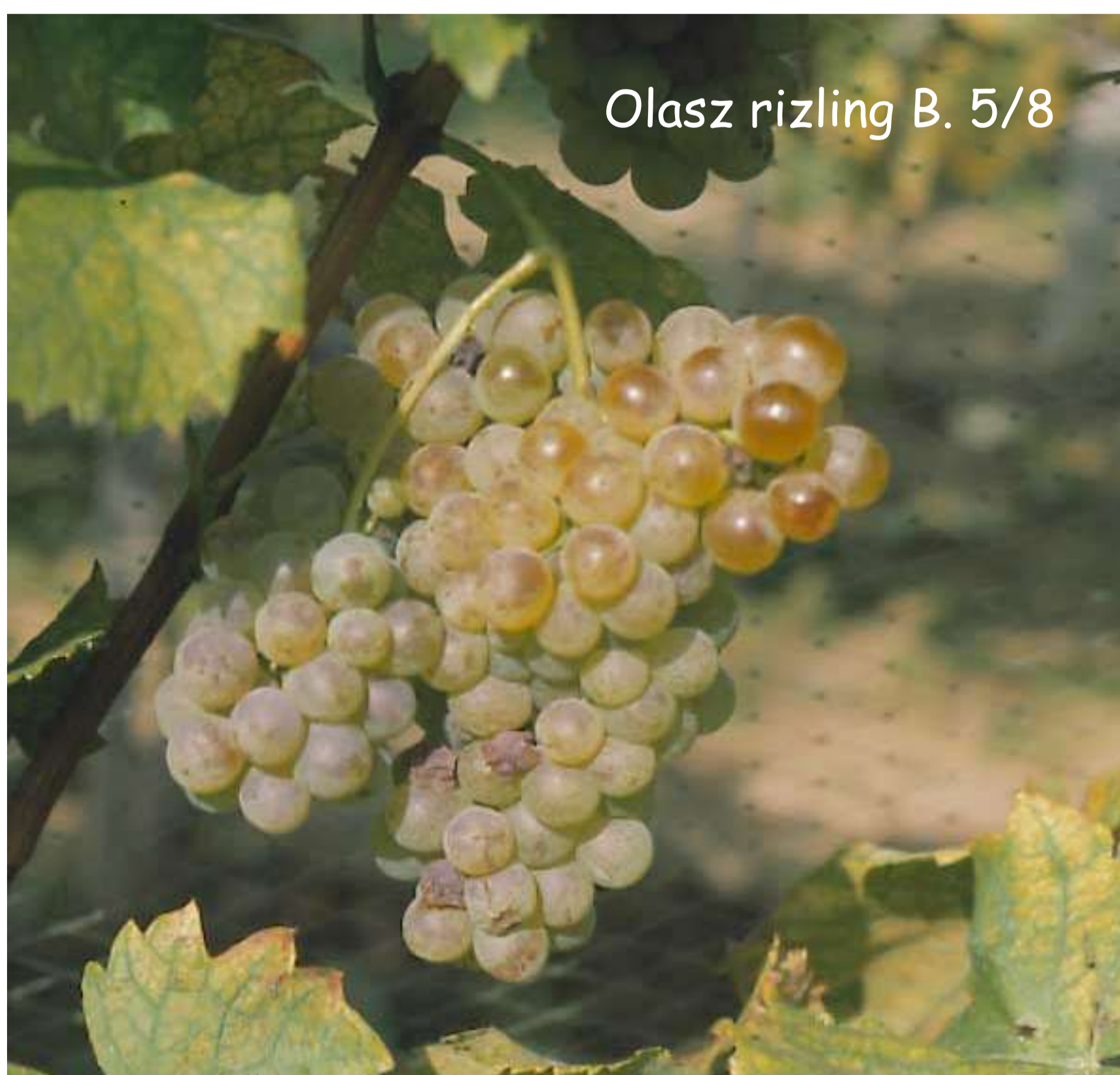
Olasz rizling B. 5/8

Az Olasz rizling és Szürkebarát fajták a Balatoni Borvidéki Régióban vezető szerepet játszanak, ezért úgy ítéljük meg, hogy az újonnan állami minősítést kapott klónok jól hasznosíthatók a régió szőlőtermesztésében, de az ország többi borvidékét is sikeresek lehetnek.