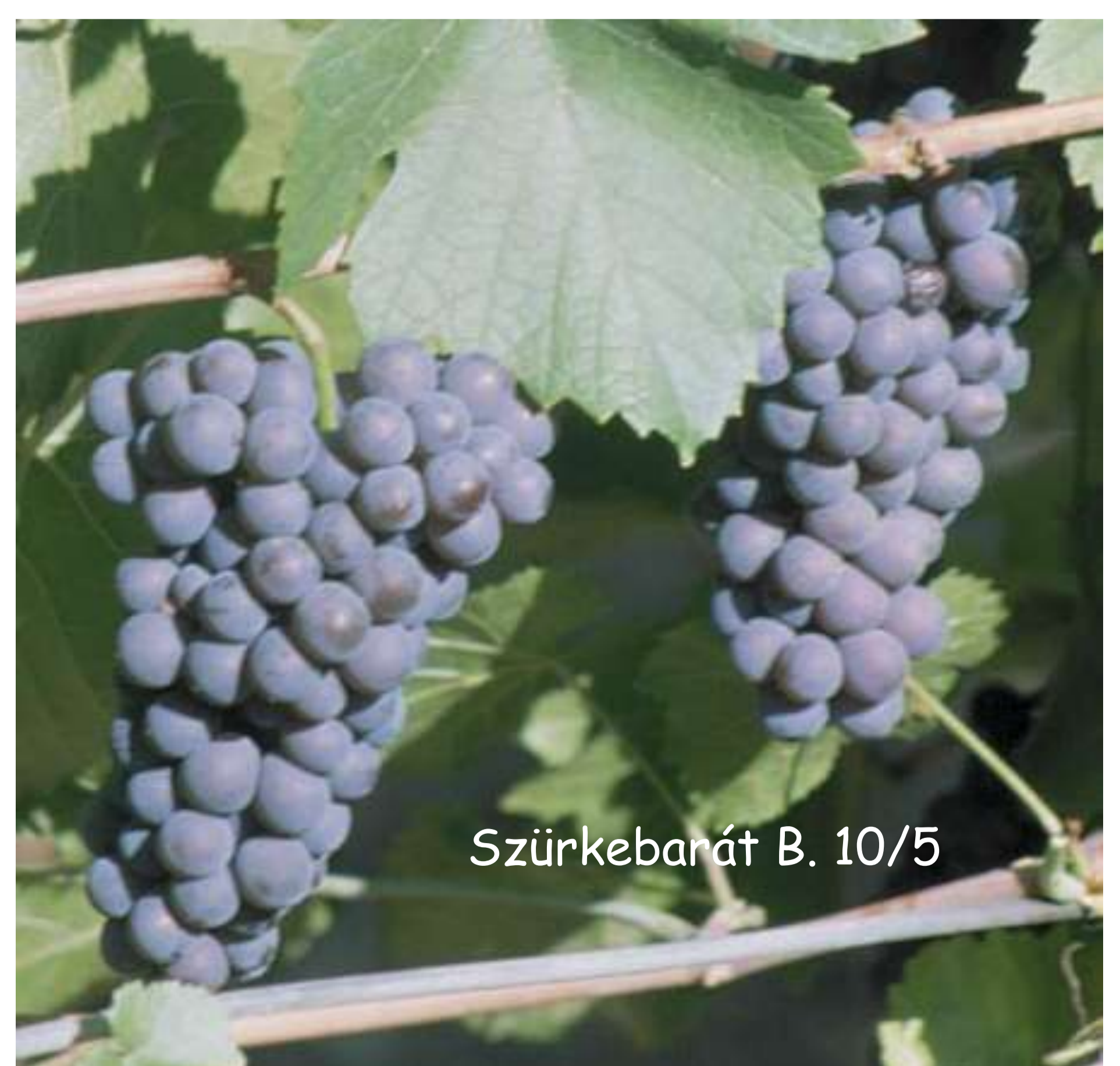
Szürkebarát B. 10/5