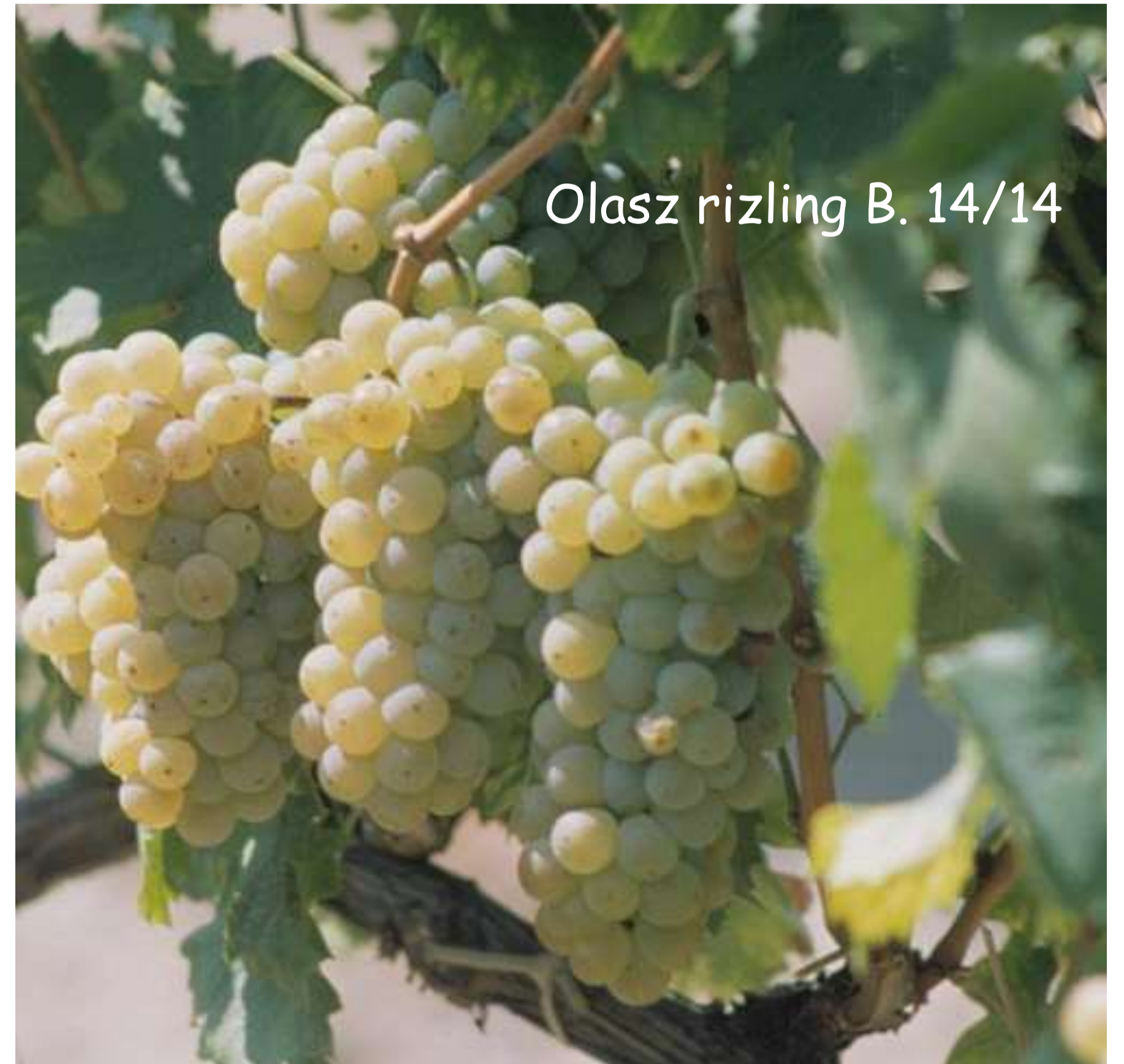
Olasz rizling B. 14/14